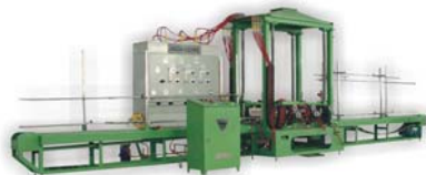
自动气体烧焊机 Automatic Welding Machine