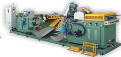
全自动发夹型弯管机 Full Auto Hairpin Bender