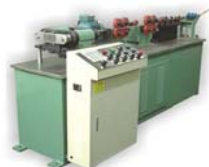
保温管切割机 Isolated Tube Cut Off Machine