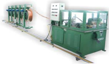
小弯头自动成形机 Return Bender

换热器成套设备生产商 Manufacturer of Machinery for Heatexchange Coil Production