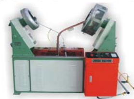
自动套环机 Ling Loading Machine