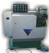
管端成形机 Pipe end Shapping Machine