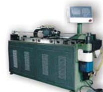
数控三维弯管机 Cnc Universal Tube Bender