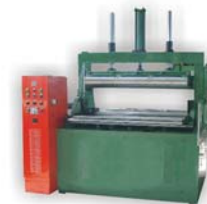
换热器折弯机 Column Heat Exchanger Bender