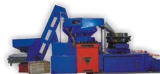
小弯头去毛刺清洗机 U Bender Cleaning Machine