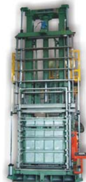
立式胀管机 Vertical Expander