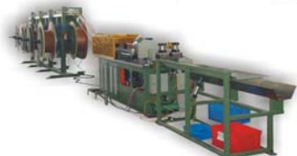
盘管校直切割机 Automatic Straightening & Cutting Machine