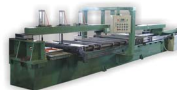
卧式胀管机 Horizontal Tube Expander