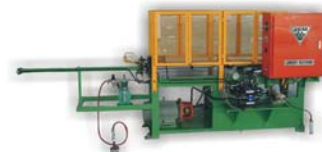
半自动发夹型管弯管机 Semi-auto Hairpin Bender