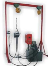
手提式双杆胀管机 Portable Tube Expander