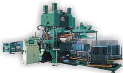
空调翅片高速冲压生产线 Fin Press Lines